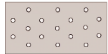
60 x 2,0 mm Ø5,0